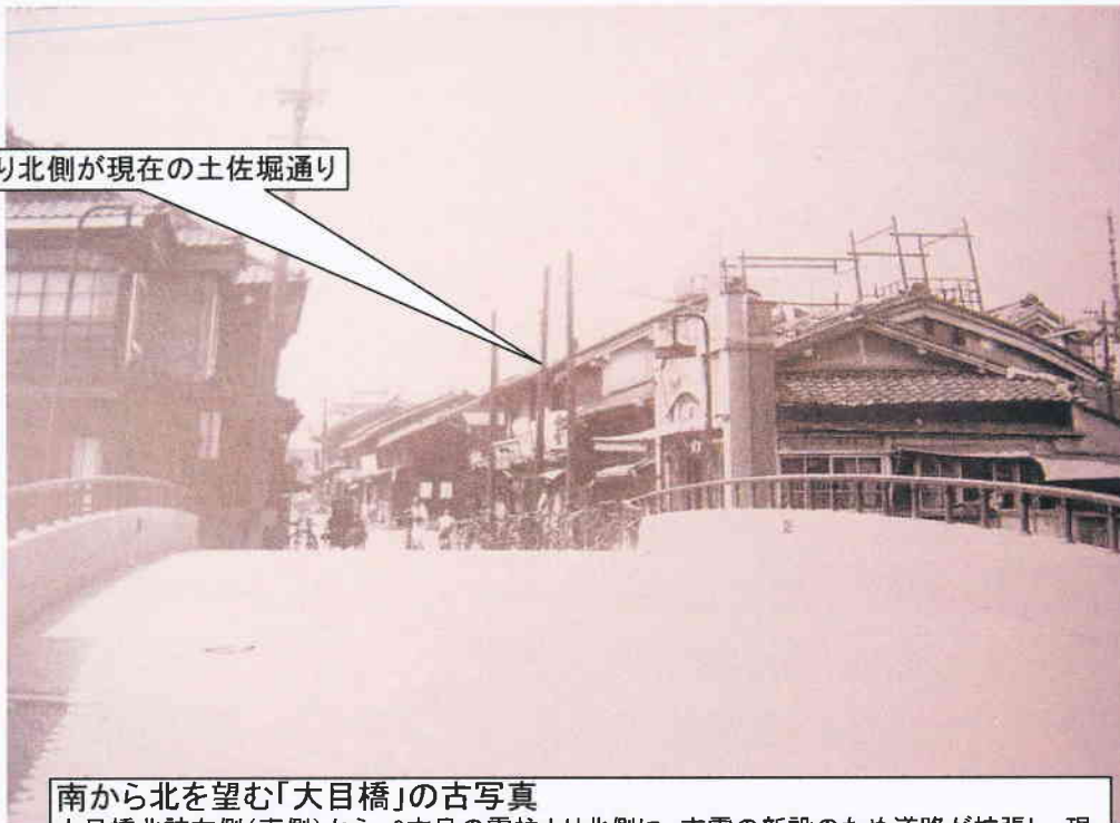
この電柱より北側が現在の土佐堀通り