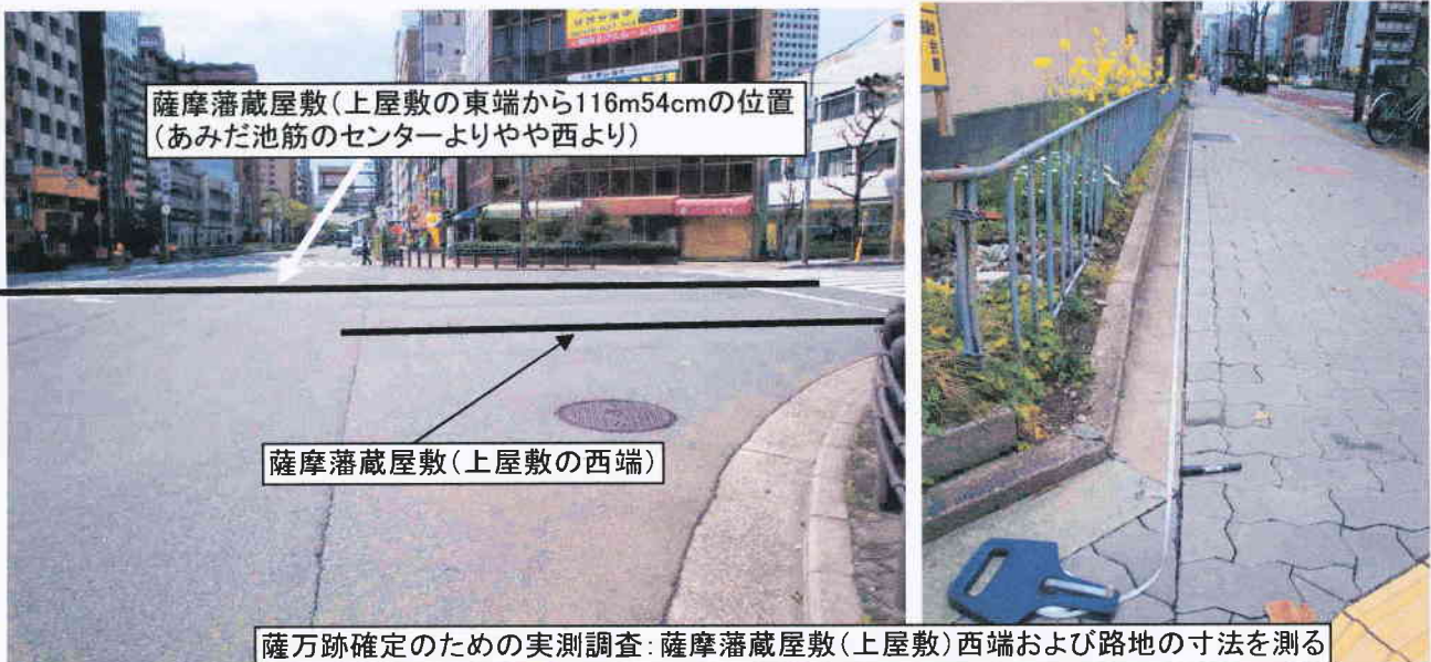
薩万跡確定のための実測調査: 薩摩藩蔵屋敷(上屋敷)西端および路地の寸法を測る