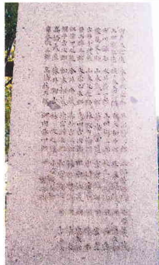
48名が銘記されている