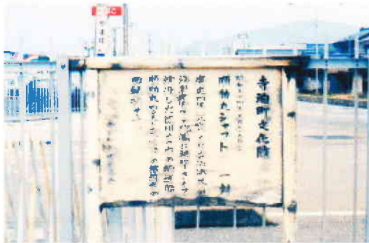
順動丸のシャフト

順動丸は慶応4年(1868)5月24日、寺泊港外(新潟県三島郡)において薩長連合に追われ、浅瀬に乗り上げて自爆しました。2本の動輪シャフトは今も大切に保存されています。