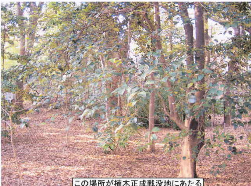
この場所が楠木正成戦没地にあたる

湊川神社の表門から入り、一番左奥が終焉の地にあたります。(終焉地は別の説もあり)