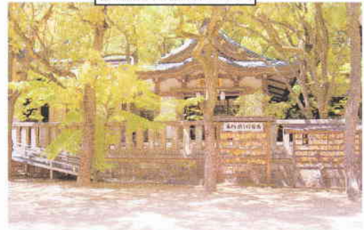
伊藤博文像があった場所