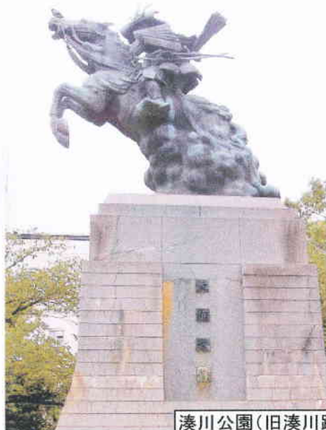
湊川公園(旧湊川跡)にある楠木正成像と説明の碑

明治になり南北朝正閏論を経て南朝が正統であるとされると、「大楠公」と呼ばれ、講談などでは『三国志演義』の諸葛孔明の天才軍師的イメージと重ねて語られました。