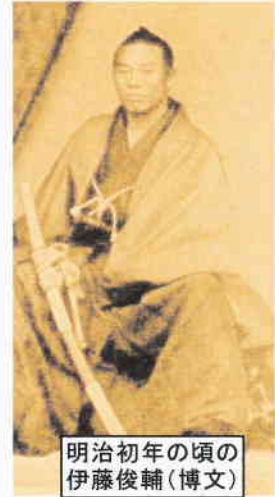
明治初年の頃の 伊藤俊輔(博文)