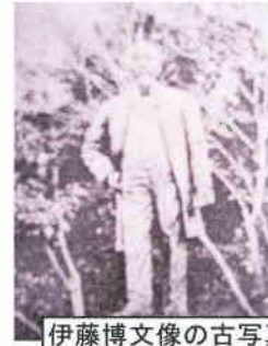
伊藤博文像の古写真