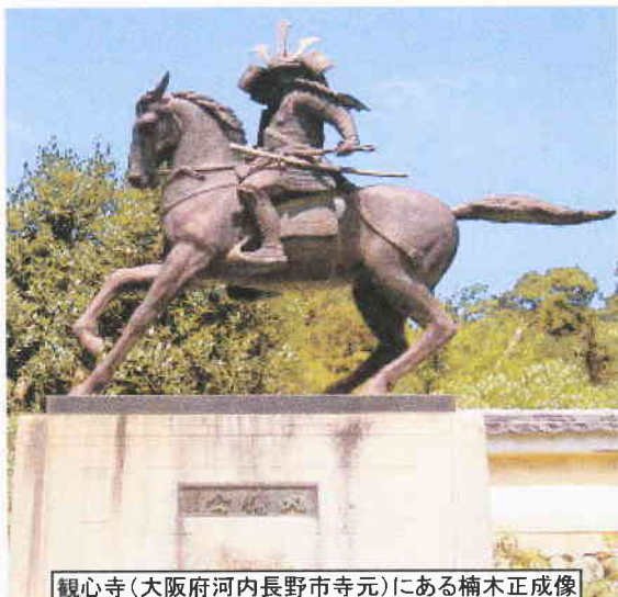
観心寺(大阪府河内長野市寺元)にある楠木正成像