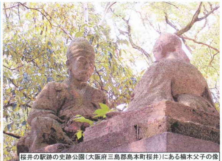
桜井の駅跡の史跡公園(大阪府三島郡島本町桜井)にある楠木父子の像