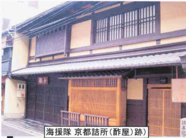
海援隊 京都詰所(酢屋)跡