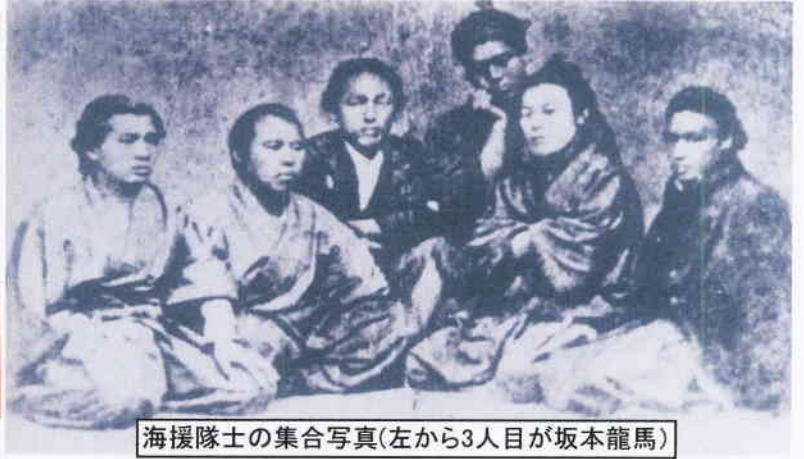
海援隊士の集合写真(左から3人目が坂本龍馬)