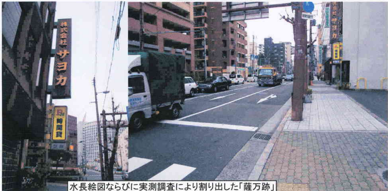
水長絵図ならびに実測調査により割り出した「薩万跡」