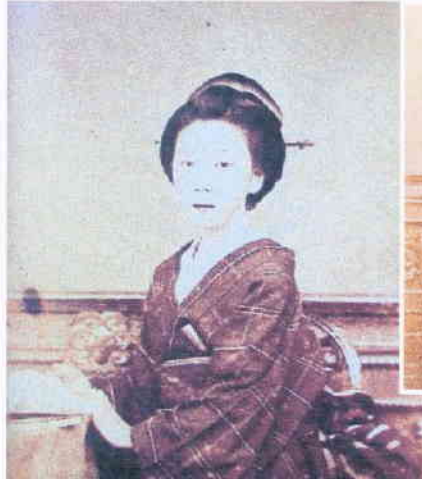
龍馬の死後、薩万に宿泊し、女将であるおりせに世話になったことがある坂本龍馬の妻 お龍