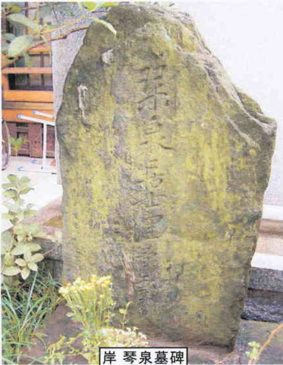
岸 琴 泉 墓 碑