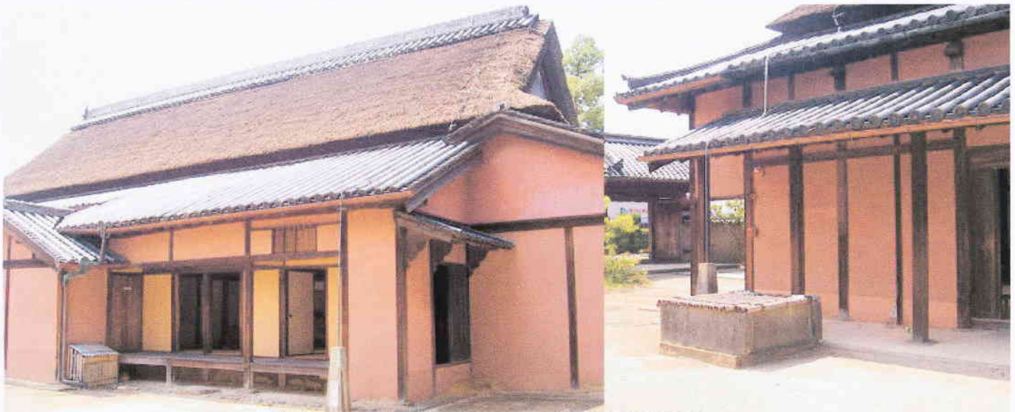
重要文化財に指定されている中 左近邸(中家)

中家住宅は、昭和39年(1964)5月29日に重要文化財に指定されました。主屋は入母屋造り、茅葺き・妻入りで、周囲に本瓦葺の庇をめぐらしています。中家住宅は、現在でも広い敷地を占めますが、江戸時代後期の古い図によると、今よりもはるかに大きく、主屋の東側には別棟の式台玄関のつく客殿(書院)がありました。