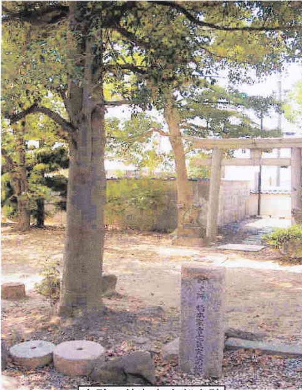
実験に使われた松と碑