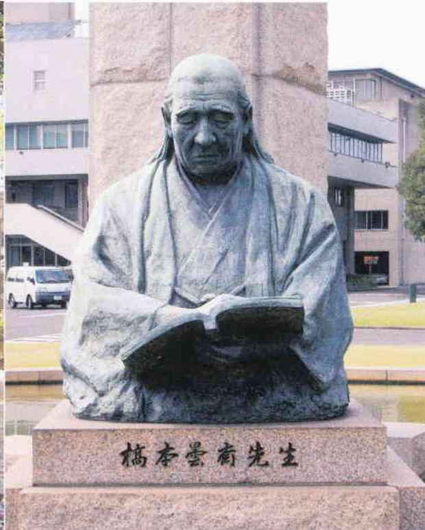
大手電機メーカー本社の庭にある橋本宗吉(曇齋)像